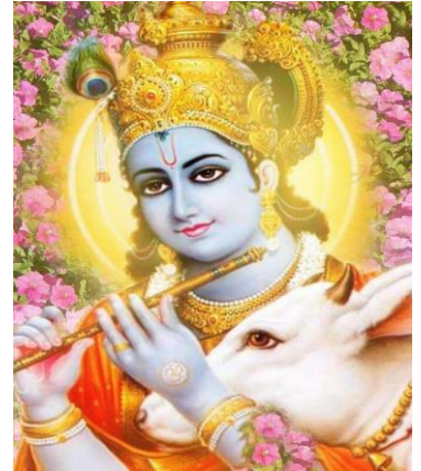
Krishna – 8 ème avatar

Notons aussi, qu'après l'arrivée des Jésuites, chargés de leur conversion, les Brahmanes séduits proposèrent de placer le Christ dans les avatars de Vishnou, ce qui ne fut pas accepté par les Jésuites horrifiés.